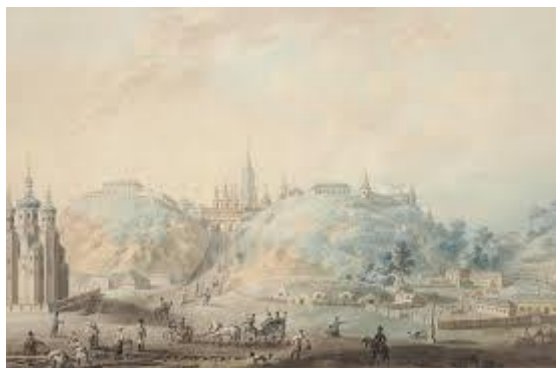
تابولسک در ابتدای سده نوزدهم

۴. یک روز آهنگ‌ساز با گمان آن‌که یک زمین‌دار را به هلاکت رسانده، دستگیر شد. اما فرنوده [ثابت] نشد که او این کار را کرده باشد، اما این گمان آن‌هم با انگار داشتن [در نظر گرفتن] این جستار که او به گروه‌های دکابریست‌ها نزدیک بود، برای گنه‌کار بودن و فرستادن او به سبیری و گرفتن برنام [عنوان] درباری و همه دارایی‌های او، بسنده بود. دوستان و خویشاوندان او بارها به امپراتور نیکلای نخست دادخواست برای بخشش او فرستادند، اما همه آنها رد شدند. اما نه همه چیز بی‌اندازه اندوهگین بود. او را به تابولسک فرستادند، که به‌هیچ‌گونه بیمی از آن نداشت، زیرا او در این شهر دوران کودکی و نوجوانی خود را گذرانده بود، و او از آنجا خوشش می‌آمد.